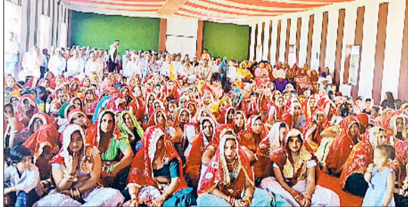
रेवाड़ी। कार्यक्रम में मौजूद महिलाएं व गणमान्य लोग।

निरंतर उत्कृष्ट कार्य कर रहा है। चेयरमैन ने सभी शिक्षकों, कर्मचारियों, अभिभावकों और विद्यार्थियों का आभार व्यक्त करते हुए कहा कि विद्यालय की उपलब्धियां सभी के सामूहिक प्रयासों का परिणाम हैं।