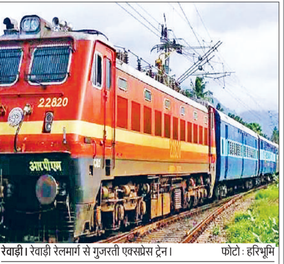
रेवाड़ी। रेवाड़ी रेलमार्ग से गुजरती एक्सप्रेस ट्रेन।