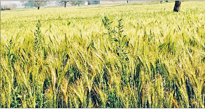
रेवाड़ी। गेहूं की फसल के बीच में ऊग रही खरपतवार।

तापमान 28 डिग्री के आसपास बना हुआ था। इस बार यह 34 डिग्री को पार कर चुका है। कृषि विशेषज्ञों के अनुसार इस समय गेहूं की फसल के लिए दिन का तापमान 30 डिग्री तक बने रहना अनुकूल है। इससे अधिक तापमान फसल को भारी नुकसान पहुंचा सकता है। रात का तापमान अभी भी फसल के लिए अनुकूल माना जा रहा है। यह 12 से 13 डिग्री तक उपयुक्त माना जाता है। कृषि विशेषज्ञों के अनुसार बढ़ता हुआ तापमान गेहूं की फसल पर प्रतिकूल असर डालता है। इससे गेहूं के दोनों के भराव की प्रक्रिया प्रभावित होती है, जिससे दाना छोटा और हल्का रह जाता है। फसल समय से पहले पककर तैयार होने लगती है। फसल उत्पादन में इससे काफी कमी आने की आशंका बनी रहती है। इस समय कई खेतों में गेहूं की फसल किनारों पर सूखनी शुरू हो गई है। दीमक का प्रकोप भी अपना काम करने लगा है, जिससे फसल उत्पादन पर असर पड़ना तय है। बढ़े हुए तापमान में फसल को वैज्ञानिक उपायों से बचाया जा सकता है।