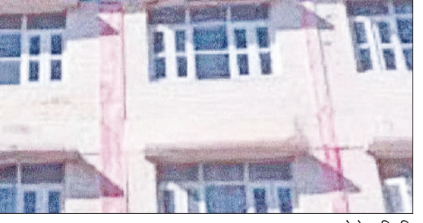
रेवाड़ी। मॉडल टाउन थाना परिसर।

■ आरोपी के खिलाफ पहले भी आपराधिक मामले दर्ज हैं